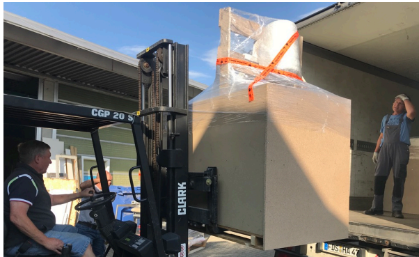
Der C-Arm sicher verpackt.