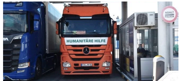
Ankunft des LKW von „H. & H. e.V.“ am Hafen in Durres

Der Verein kümmert sich um den Transport des Gerätes nach Albanien, sowie die Erstellung von den Zollpapieren und die Abwicklung am Zoll. Am Morgen des 01. Oktober ist der LKW am Zoll in Durres/Albanien angekommen.