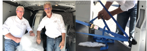
C-Armgerät und Monitore sicher im Transporter verstaut

Bis zum Transport nach Albanien konnten wir das C-Arm Röntgengerät bei einer befreundeten Firma - Holz Concept GmbH in Nufringen - zwischengelagern.